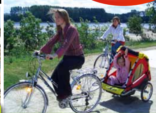
Ingrandes / Le Fresne-sur-loire : frontière historique entre la Bretagne et l'Anjou